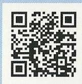
食品業者登錄平台