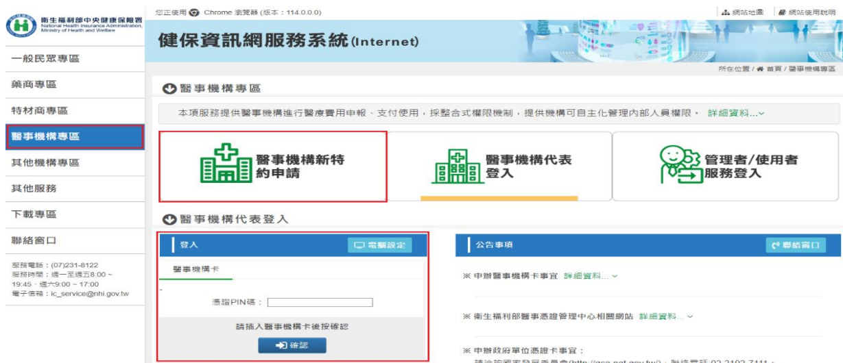
圖-1 健保資訊網服務系統 (Internet) 首頁

(一) 進入健保資訊網(Internet)服務平台後選擇「醫事機構專區」，然後點選「醫事機構新特約申請登入」如圖-1，進入如下畫面的「HMAE2101S01_醫事機構新特約申請登入作業」如圖-2。