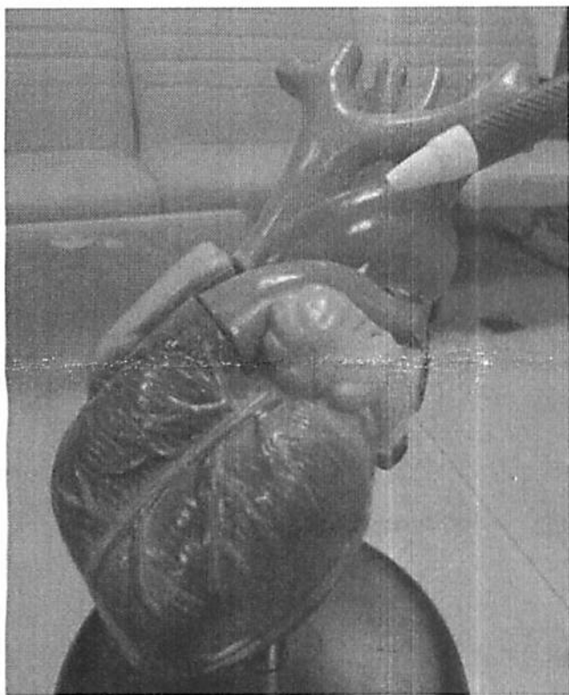
心血管疾病名列國人10大死因前3位，心導管手術因而成重要的救命手術。

〔本報訊〕這年頭不僅食物黑心，就連「心導管」也能黑！新北市衛生局日前查獲無良業者，將過期的心導管重貼標籤後再出售給醫院，販售遍及全國各大醫院，且疑似不是第一次，警方目前正擴大偵辦中。